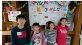
仲良くして下さい♪