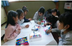
歓迎会ポスター作成中♥ 1年生も参加(笑)

新年度がスタートし、5/18(金)歓迎会と4月お誕生会をしました。 通常利用1年生3名、4年生1名が入会し、ますます賑わっています