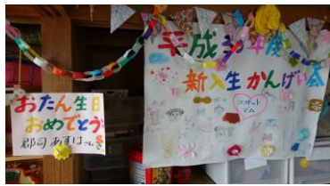
素敵なポスターが出来上がりました。お祝いメニューです♥