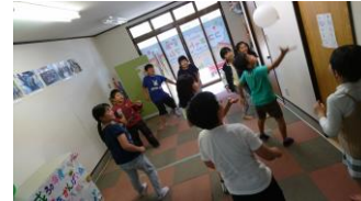
毎日汗だくです(笑)

毎日ブロックや本読み、 手芸、お絵かき、 1階フロアにて 男子、女子ミックスの 風船パレーをして 過ごしています。