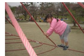
遊んだあとのお弁当美味しいね♪