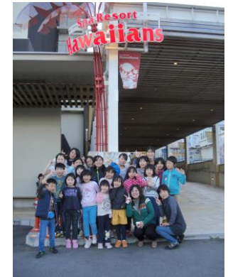
また来ようね～ アローハー!!