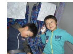
まだまだ元気な子