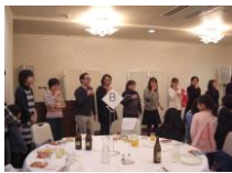
ロシアンシュークリーム アタリはだーれ？