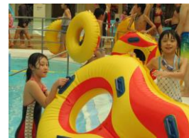
高学年はスライダーが大好き!