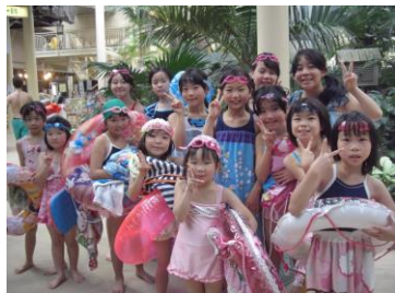
着替えていざプールへ