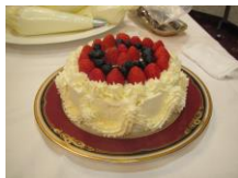
子ども達がデコレーション♪