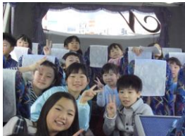
車内にて…早くつかないかなあ～

H26・11月15日(土)恒例のおでかけイベント 児童18名、スタッフ4名にて いわき市にあるスパリゾートハワイアンズに行き 流れるプール、スライダー、ハワイアンショーなどで一日 楽しみました。