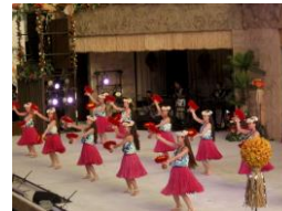
ハワイアンショー