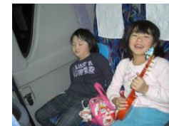
車内では疲れて寝る子