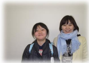
桑野小4年土釜めくさんとお母さん

子どもたちをみているといつも楽しそうにしています。先生方を友達のように、お姉さんのように、また母のように?!慕っているのがわかります。毎日のびのびと、子どもが子どもらしく過ごせる場だと思います。これからもよろしく願い致します。