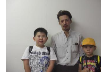
3年 H.R君 1年H.R君

学童に通い始めて新しい友達と遊んだり、新しい遊びを覚えたり二人とも楽しそうなのでよかったです。