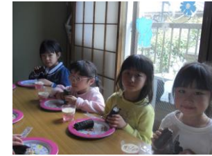
今月はのり巻きと ゼリーでお祝いです