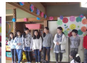
5年、6年生:数を言ってグループになるゲーム