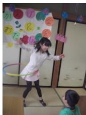
4年生:フラフープを披露