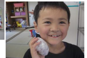
自分でにぎったよ♪