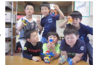
男子が増え、いちだんと賑やかです。

今年度は男子児童が増えた為トラブルもありますが子ども達が話し合っ解決できるように見守っていこうと思います。