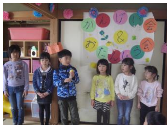
4月に入った新児童6名です