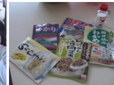
好きな味を選んで 自分でにぎります